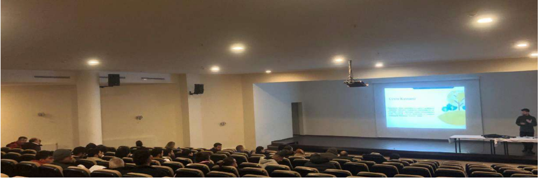
Çevre ve Sürdürülebilir Turizm Eğitimi