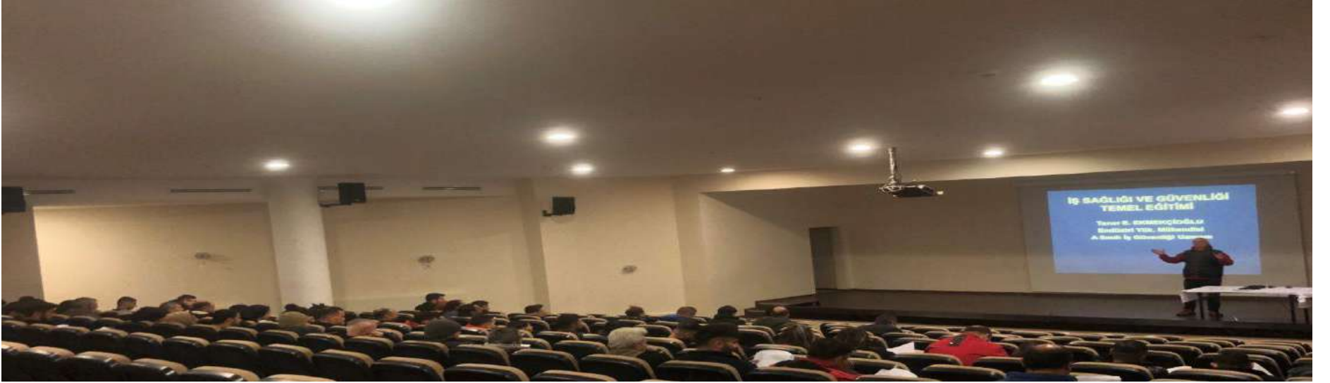
İş Sağlığı ve Güvenliği Eğitimi