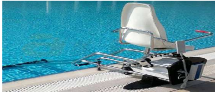
Havuz Engelli Lifti

Bu çerçevede dezavantajlı farkındalık politikamız herkes için eşit şartlarda tatilin önündeki engelin kaldırılmasıdır.